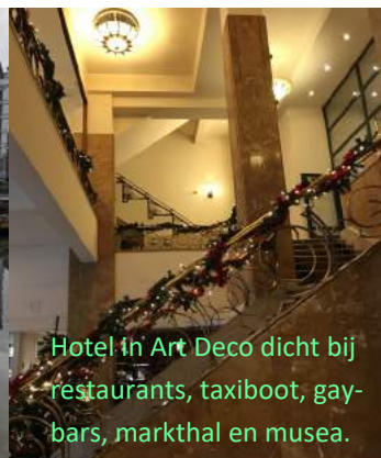
Hotel in Art Deco dicht bij restaurants, taxiboot, gay-bars, markthal en musea.