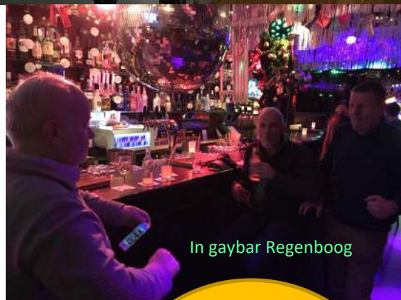
In gaybar Regenboog